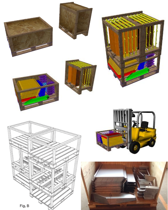
Modelos tridimensionales y construcción de prototipo

contenía los paneles laterales, las placas, los tabiques, los conjuntos dosificadores secos y la tornillería, mientras que el otro, contenía los fondos y los conjuntos dosificadores húmedos. Vale aclarar que la propuesta se basa en un cajón construido a partir de un pallet de intercambio tipo ARLOG con sus medidas standard. De esta manera, se trabaja con medidas modulares establecidas en el sector logístico. Bajo este concepto, surgió la siguiente propuesta: