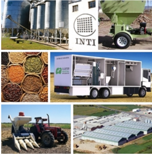
Figura 1. Banco de soluciones tecnológicas.

En la primera etapa se trabajó en pos de la producción de un concepto operativo de desarrollo regional con base en la estructura territorial y la dinámica social y en esa línea se enfocaron los talleres: por un lado en la confección de mapas y territorios, dinámicas económicas, flujos, personas, mercados, y por el otro, en la espacialidad regional, con foco en las disparidades/desigualdades.