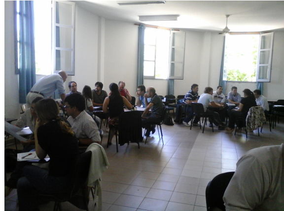
Figura 2. Taller realizado en diciembre del 2014 en INTI-Entre Ríos

El programa contó en una primera instancia con agentes INTI, y queda previsto para futuras acciones articular con actores sociales locales involucrados, tanto de ámbitos públicos como privados. Es decir, se ve cumplimentada la primera etapa del proyecto, en donde se operó "hacia adentro" de los equipos de los centros regionales de investigación y desarrollo y de las unidades de extensión que vienen llevando este tipo de experiencias. Esto generó contar con una experticia en el INTI que potencia el rol del agente de desarrollo local.