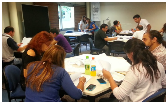
Curso Norma 17025:2005 – Nivel Medio

Actualmente, a partir de la emergencia y detección de nuevas necesidades de formación, el Programa se ha ampliado incorporando nuevos y variados temas formativos orientados a afianzar y actualizar los conocimientos técnicos específicos, procurando cubrir las demandas de todas las Unidades y Dependencias del país, llegando a un número de 34 cursos que forman hoy parte de la oferta estable de capacitaciones que se pueden abordar en el Instituto con expertos y referente internos.