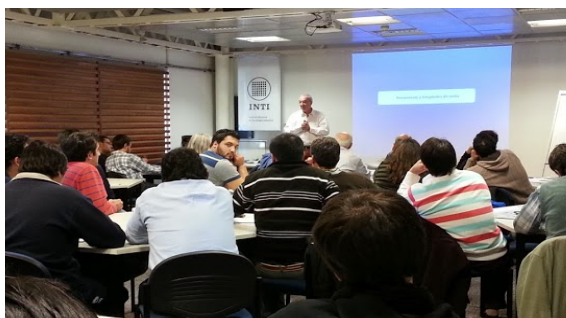
Curso Introducción a la Metrología – Nivel de Iniciación

En el contexto actual la formación, basada en la perspectiva de educación permanente, representa un factor clave para el desarrollo de las personas, para su integración en los diversos ámbitos sociales y en especial para las organizaciones que se inscriben en contextos laborales. En este sentido la capacitación aparece como una actividad facilitadora de los procesos de cambio y transformación, cambios que deben reflejarse en los comportamientos y desempeños laborales de aquellos que conforman una organización. En este sentido y reconociendo la importancia de contar con un Programa integral e institucional de formación permanente para el personal del INTI en estas temáticas, se avanzó conjuntamente con la Gerencia de Calidad y Ambiente, en el desarrollo de diversos trayectos de formación para diferentes destinatarios. Tal iniciativa fue cobrando relevancia con la aprobación del Programa Institucional del Capacitación (PIC), en el año 2007. El PIC condensa e institucionaliza la formación básica -saberes, habilidades y actitudes- requeridas para el personal del INTI de acuerdo a la misión del Instituto.