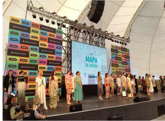
Figura 3: Pasarela Federal INTI en Tecnópolis

A mediano plazo, el proyecto incluye la proyección internacional de la pasarela y la extensión del análisis al formato audiovisual.