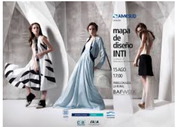
Figura 4: Pieza gráfica Pasarela Federal INTI