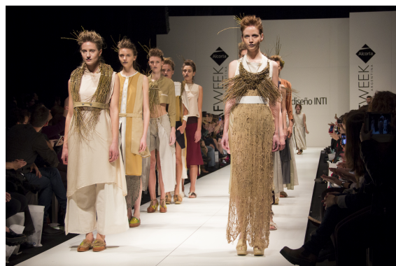
Figura 1: Pasarela Federal INTI en BAFWEEK

A partir de ahí, comienza un camino que abarca tanto la creación de conceptos inspiracionales rectores como el seguimiento del proceso proyectual y su materialización. De igual manera, se trabaja en la producción fotográfica y audiovisual, estilismo y la puesta en escena de la pasarela.