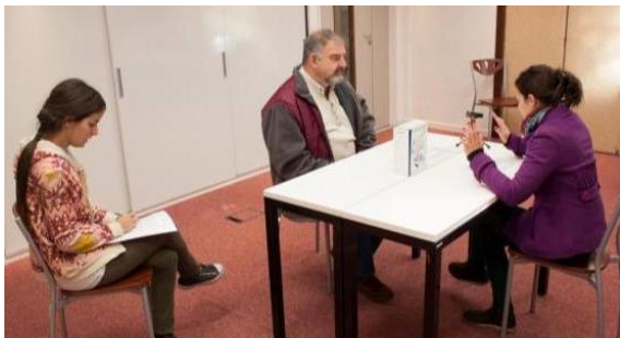
Figura 2: Desarrollo de Pruebas con usuarios en un contexto de laboratorio

En la mayoría de las oportunidades es difícil realizar las pruebas en los contextos habituales de uso de los productos. Por otra parte, simular el uso de todas las funciones en un contexto de laboratorio resulta muy complejo por los tiempos que implicaría —y sus costos asociados— y las condiciones de ese espacio físico. Por estos motivos es importante ambientar un espacio lo más parecido al real, determinando las tareas a analizar con un protocolo que pueda repetirse de una prueba a otra.