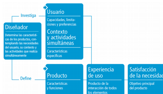
Figura 1: El usuario, su contexto y los productos

Cuando hablamos de usabilidad el foco no está puesto en si el usuario quiere comprar o poseer el producto, lo que realmente resulta relevante es si el usuario logra mínimamente hacer lo que el diseñador esperaba que hiciera con el producto de manera eficiente, si la experiencia de uso le resulta satisfactoria y si en usos sucesivos el usuario puede aprender y recordar como interactuar con el mismo.