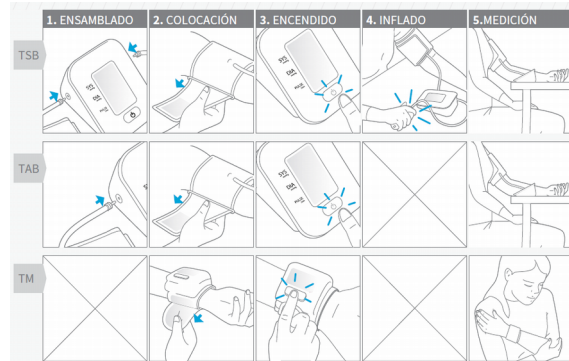
Figura 3: Secuencia de uso de 3 tipologías de tensiómetros digitales existentes en el mercado