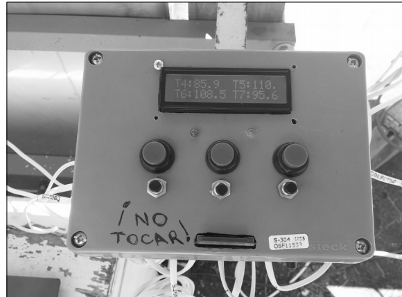
Figura 4: SAD instalado.

Además del almacenamiento, el SAD dispone de una pantalla donde se observan los valores instantáneos que entregan los sensores codificados de T0 a T14, tiempo faltante hasta la próxima adquisición, fecha y hora actuales.