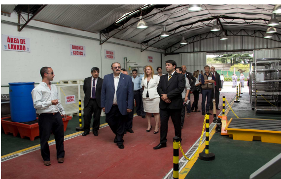
Inauguración. Complejo Penitenciario Federal de Devoto.