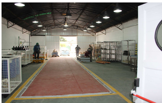
Vista frontal de la planta en pleno proceso de construcción. Complejo Penitenciario Federal de Devoto.