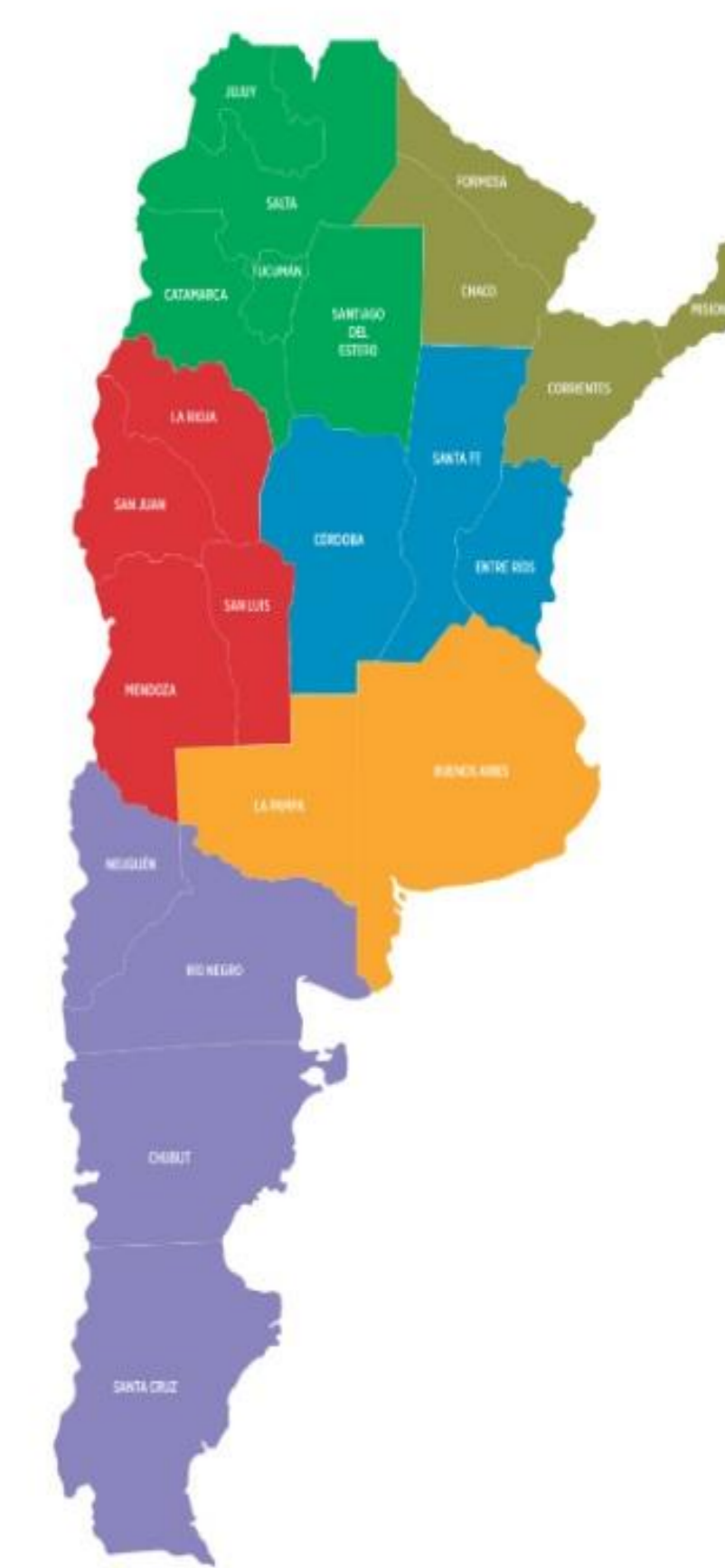
Gráfico con la distribución de las diferentes regiones del INTI.