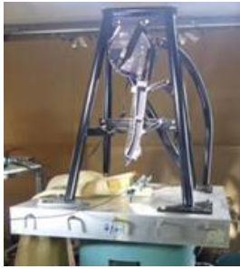
Figura 1: Ensayos del dosificador de siembra de precisión sobre un shaker de INTI.

semillas para evaluar la homogeneidad de los flujos de semillas.