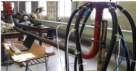
Figura 3: Banco de ensayo del sistema air drill - FCEIA.