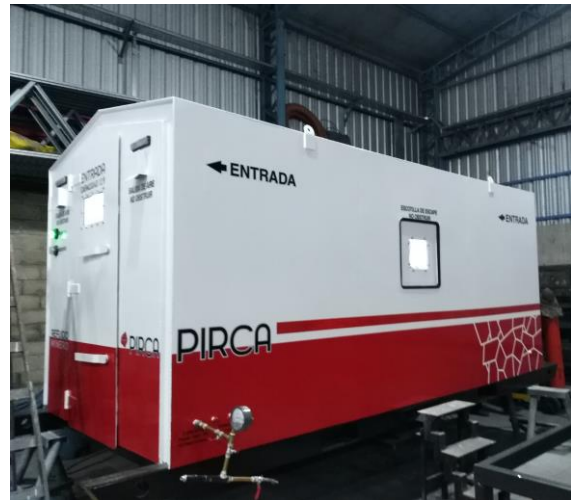
Figura N°1: Refugio minero PIRCA Safety® modelo P-RMS

A partir de estas dimensiones se desprende una tasa de ocupación propia del refugio PIRCA® modelo P-RMS de 0,51 persona/m 3 . El refugio PIRCA Safety® modelo P-RMS posee una unidad Scrubber de CO 2 PIRCA Safety® instalada en su interior. Figura N°2. La unidad Scrubber de CO 2 PIRCA Safety® posee 2 (dos) cartuchos de adsorción PIRCA Safety® dispuesto en un arreglo en paralelo.