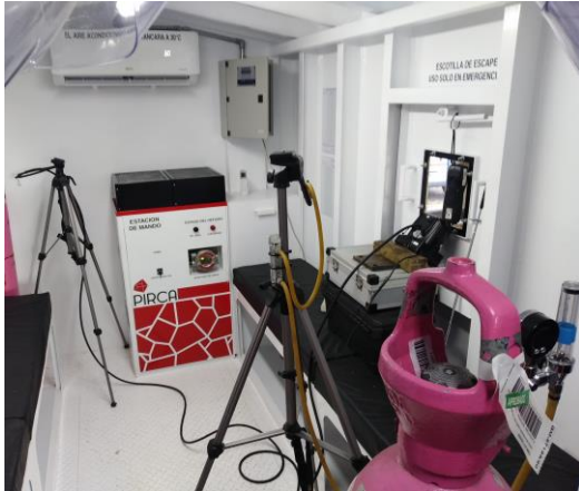
Figura N°2: Unidad Scrubber de CO 2 , y distribución de sensores e instrumental dentro del refugio PIRCA Safety® modelo P-RMS.

EL instrumental principal utilizado fue: