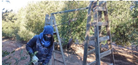
Fig. 4 - Armado de fardos y pesaje de poda de olivo variedad Arbequina.

Este trabajo tiene como propósito, a través del trabajo en Red, unificar criterios de asistencia técnica en una temática en auge y sumar capacidades asistencia técnica al Instituto, no obstante, se debe continuar con los estudios en campo, contrastando la gestión con los estudios analíticos de las calidades de cada sustrato bajo lineamientos de la norma ISO17225 para continuar con las validaciones de potencial energético y para poder extrapolar a diferentes campos y regiones.