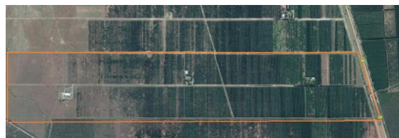
Fig. 2 - Caso de Estudio A. Capayán, Catamarca

El relevamiento fue llevado a cabo por especialistas de DERNOA y DMyCPI. Este trabajo se enfocó en los residuos de la poda, realizada en plantaciones olivícolas una vez al año para mejorar el rendimiento. El estudio se enfocó en una finca tipo del corredor productivo de 200 hectáreas sembradas con un formato trapezoidal cuyos lados más largos tienen una orientación este-oeste. El modelo cuenta con dos sectores, uno al norte y otro al sur con 567 Filas de 324m con 73 plantas a 4.50 metros de distancia de eje a eje. Esta matriz se repite a lo largo de toda la finca.