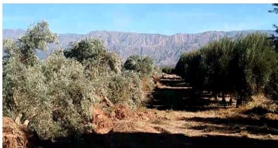
Fig. 1 – Poda de olivares.

De acuerdo con los datos estadísticos, uno de los costos operativos que más impactan en el sector olivícola es el de la energía eléctrica, principalmente en lo referente al bombeo de agua subterránea a la superficie para riego.