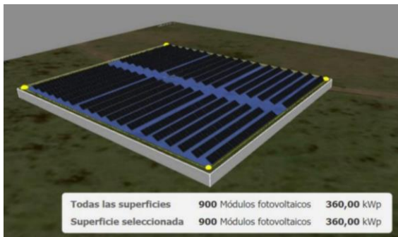
Figura 2: Ejemplo de emplazamiento FV vista diagonal.