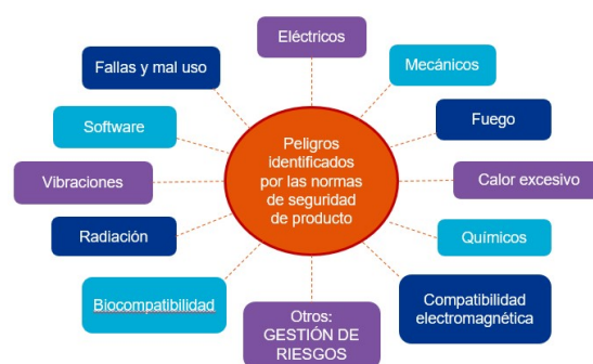
Figura 2: Peligros abordados por la familia de normas IEC 60601.