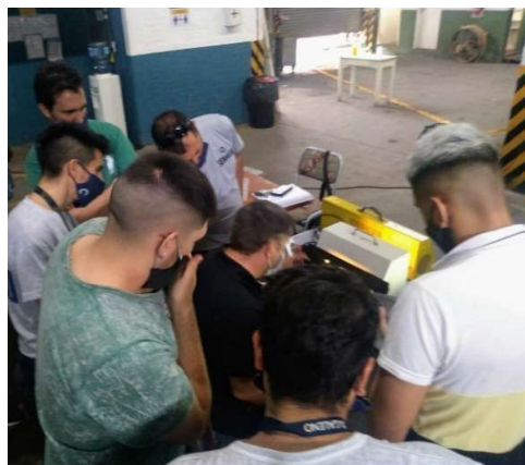
Figura 2: Primer curso semi-presencial con prácticas dictadas en planta. Articulación AAENDE-INTI.

En noviembre de 2021 ambas instituciones presentan la propuesta de la creación del observatorio a los actores relevantes del sector, en el marco de la XIIª edición del Congreso Regional de Ensayos No Destructivos y Estructurales (CORENDE), organizado conjuntamente por el INTI y la Asociación Argentina de Ensayos No Destructivos y Estructurales (AAENDE).