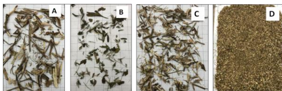
Figura 2. A) Ramas finas y astillas. B) Hojas. C) Palillos y astillas. D) Finos.

De la fracción media chipeada (Figura 2), en el estudio fotométrico por dispersión manual, se encontró que el 62% era menor a 5 mm (Figura 2D) y el resto era material lignocelulósico derivado de ramas finas, palillos, hojas y astillas (Figura 2A, 2B, 2C), evidenciando que el material no cumple con las categorías del “chip” o “astilla” según la Norma IRAM 17225 pero que igualmente posee potencial para producir pélets o briquetas e incluso para alimentar una caldera.