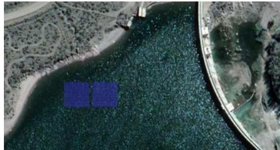
Proyecto de instalación en Mendoza

Para el desarrollo de una instalación piloto, se tienen en cuenta la irradiación, la existencia de centrales hidroeléctricas o espejos de agua dulce con baja velocidad de corriente y sin presencia de olas, el precio de un terreno en esa locación, la demanda anual de la región, la tarifa eléctrica en la misma, la evaporación anual, el impacto visual, ambiental o económico posible y la posibilidad de combinación con otras tecnologías. Realizado este estudio, resulta que es muy factible desarrollar esta tecnología en Argentina, donde proponemos instalar una planta piloto, siendo Mendoza, Córdoba, y San Juan los lugares más propicios. Nos comunicamos con los actores que intervienen en la administración del recurso hídrico y con proveedores de sistemas fotovoltaicos flotantes para avanzar con el proyecto. Así como también evaluar la posibilidad del desarrollo de proveedores nacionales de los sistemas flotantes y de amarre.