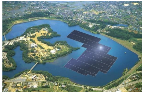
Planta de Chiba, Japón

Éste último beneficio presenta, además de ventajas en cuanto a la generación energética, una solución tecnológica para cuidar el recurso hídrico que se puede usar para otros fines. Esto representa oportunidades tanto en el sector público, por ejemplo en lo que corresponde a la administración del agua para irrigación o a la generación hidroeléctrica; o en el sector privado, como en campos de cultivo de distintas plantaciones.