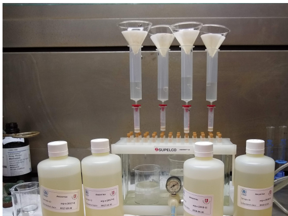
Figura 2: Extracción SPE en fase sólida.

Los estándares utilizados para la cuantificación fueron donados por la Universidad de Örebro (Suecia). Se utilizaron patrones marcados isotópicamente con ^{13}\text{C} , ^{18}\text{O} y ^2\text{H} .