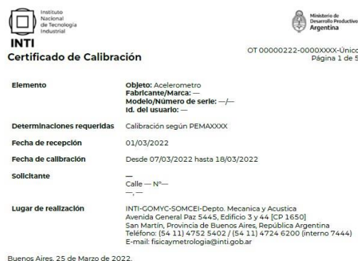
Figura 2: carátula de un certificado tradicional en formato PDF.

INTI desarrolló un software para generar certificados digitales en los servicios de metrología de vibraciones. Este software es modular y adaptable a distintos servicios. Actualmente se está trabajando para establecer los certificados digitales en los servicios de calibración de multímetros. La figura 2 muestra una carátula de certificado tradicional y la figura 3 muestra la información del laboratorio proveedor de servicios en formato DCC.