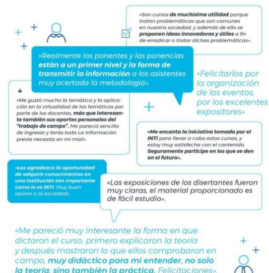
Figura 3: Algunos comentarios de participantes.

Respecto a las actividades del Calendario Ambiental puntualmente, las mismas se pudieron realizar en los tiempos programados, cumpliendo con los plazos estipulados para su ejecución; alcanzando resultados alentadores y positivos, superando en cada encuentro las expectativas de participación con amplio número de asistentes y logrando alcance internacional. Todo ello deja en evidencia la importancia y trascendencia de los temas abordados (Figura 3).