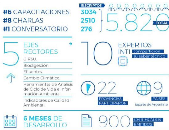
Figura 1: El Calendario Ambiental en números.