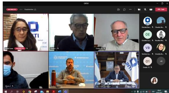
Imagen 1: Apertura del Calendario Ambiental a cargo de autoridades.

Atendiendo el contexto de pandemia, cada una de las actividades se llevó adelante de manera virtual a través de la plataforma oficial de INTI, Teams (Imagen 1). En el caso de las capacitaciones, esto permitió realizar encuestas a los participantes y evaluar el desempeño de la disertación.