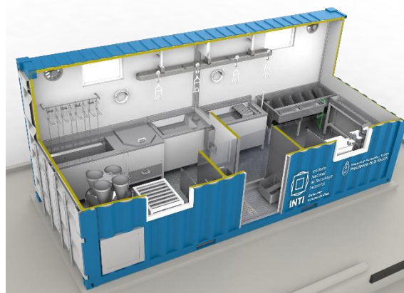
Figura 1: diseño de playa de faena en contenedor 20'.