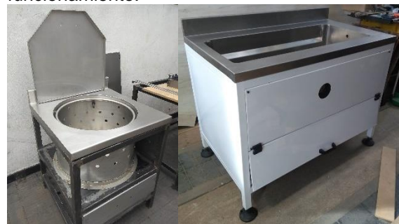
Figura 4: prototipos de peladora y escaldadora de pollos.

También se realizaron pruebas funcionales metodológicas para validación y verificación de funcionamiento.