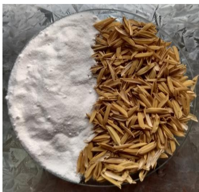
Figura 1: sílice obtenida (izq) y CA de partida (der).

En la Figura 1 se observa el producto obtenido a partir del tratamiento desarrollado. Los análisis de composición indicaron que la muestra era efectivamente 100% sílice, tanto para la CA como el RA. La difracción por rayos X confirmó que la estructura era amorfa, y la superficie específica de la sílice de CA resultó ser de 332 m 2 /g, mientras que la de RA alcanzó un valor de 188 m 2 /g.