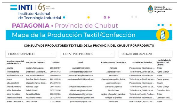
Figura 2: Sistema online de búsqueda de productor textil por producto/actividad y localidad

La versión actual fue relanzada en el sitio Argentina.gov.ar [1] desde el cual cualquier productor de la provincia del Chubut puede iniciar el registro y sus datos no solo pasan automáticamente a ser parte de los reportes estadísticos sino también se hacen visibles en el Sistema de Búsqueda de Productores Textiles BDTex-INTI CHUBUT [2].