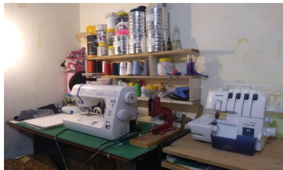
Figura 1: Producción textil/confección.

El Mapa de Productores Textiles de Chubut constituye una base de datos de esta industria chubutense, conformada por empresas y emprendimientos de producción y/o comercialización que desarrollan sus actividades en el marco del rubro textil/confección y de la moda.