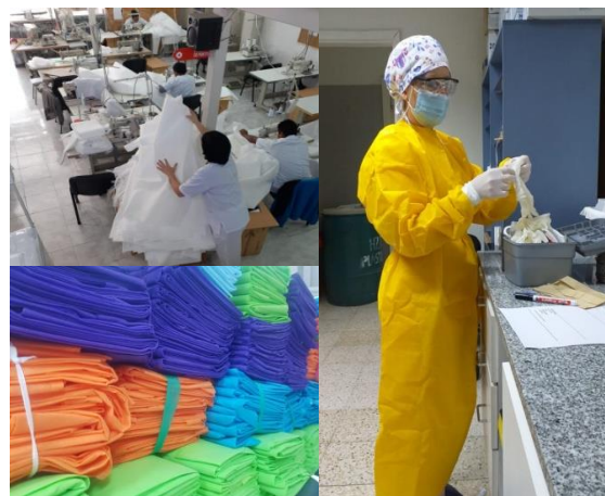
Figura 3: Confección en taller de Pto. Madryn. Camisolines listos para entregar. Personal de salud con EPP de producción local.

Se destaca la predisposición de muchas personas, tanto del INTI como de otras instituciones, aportando muchas horas para la concreción de este plan de producción. Particularmente el Hospital Zonal de Trelew destinó rápidamente fondos (a través de la Cooperadora con dinero donado por la población local) a la compra de telas y pago a los talleres. En concordancia con la situación también se valora el rol de los proveedores locales entregando telas para no demorar la producción mientras se realizaban los expedientes por parte del Ministerio de Salud. Esto permitió una rápida respuesta para que los hospitales y otras dependencias de salud pudieran contar rápidamente con los EPP.