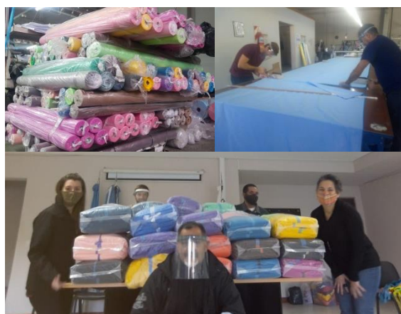
Figura 1: Recepción de friselina. Corte. Equipo INTI.

ya instalado en el mundo, se resolvió la planificación de la confección localmente.