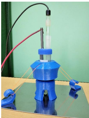
Figura 2: celda construida para superficies planas horizontales.