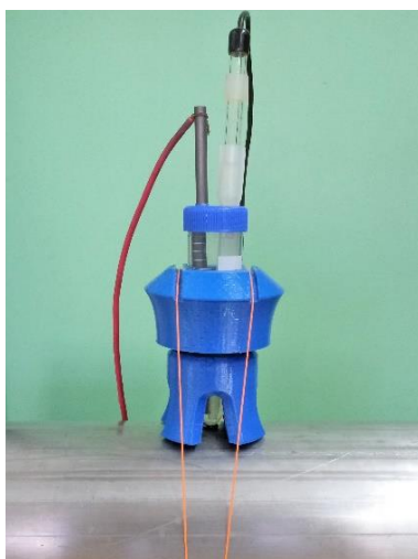
Figura 3: celda construida para superficies curvas horizontales.