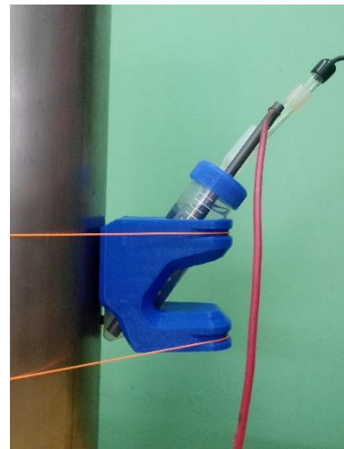
Figura 5: celda construida para superficies curvas verticales.