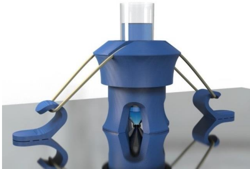
Figura 1: modelado de primer prototipo.

Este tipo de diseño tiene la versatilidad necesaria, para poder fabricar accesorios a demanda en función del tipo de equipo o componente a evaluar.