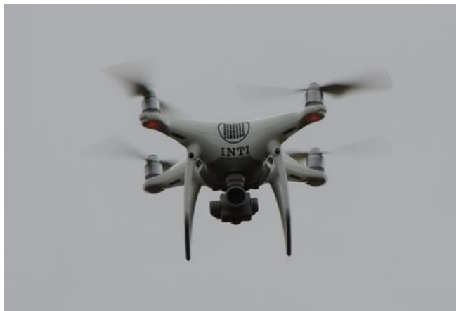
Fig. 1. Dron DJI Phantom 4 Pro utilizado en la inspección

Los vuelos de inspección consistieron en trayectorias (o corridas) de filmación en alta definición, a lo largo de cada fachada, de forma que una serie de corridas, nos permitió contar con un muy buen detalle de cada una de las cuatro (4) “caras” del edificio.