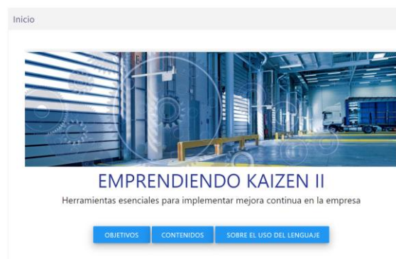
Figura 2: Curso autogestionado “Emprendiendo Kaizen” en Campus Virtual ( virtualted.inti.gov.ar )

Cada capítulo dentro del curso contiene un video de presentación a cargo de los/as autores/as, el material tanto en formato de lectura como audiolibro, la actividad de evaluación y el material teórico para descargar.