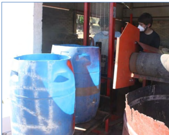
Figura 4. Pesaje de recipientes. Estudio de caracterización.

Ya separadas las fracciones, se pesaron los recipientes (Figura 4) y se midió la altura correspondiente de cada fracción, en los distintos recipientes para el posterior cálculo de volumen.