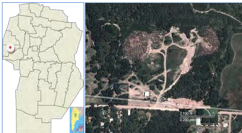
Figura 1. Localización de la ciudad y la planta de tratamientos de RSU de Unquillo.