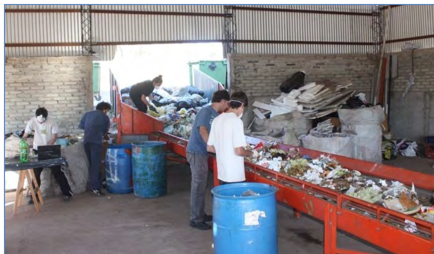
Figura 3. Clasificación de residuos. Estudio de caracterización.

Ya separadas las fracciones, se pesaron los recipientes (Figura 4) y se midió la altura correspondiente de cada fracción, en los distintos recipientes para el posterior cálculo de volumen.